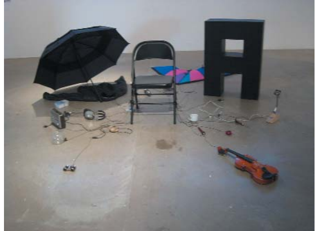
John Perreault. Utería de la instalación Critical Mass II (Masas críticas), 2008. The Laboratory for Art and Idea , Belmar, Colorado. [Recreación de Critical Mass , Whitney Museum, 1971].

Había una consigna gubernamental en los Estados Unidos, durante la Segunda Guerra Mundial: Loose lips sink ships (la lengua suelta hunde los barcos). 2 Esta es la consigna de los artistas de ahora: los barcos serían el mercado de arte y el sistema basado en el mercado de arte. Ambos, en última instancia, se derivan de las